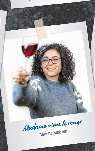
Madame aime le rouge Influenceuse vin